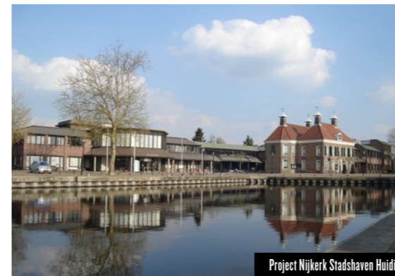
Project Nijkerk Stadshaven Huidig

Het multidisciplinaire team draait bij Horapark dus op volle toeren. Meijer: 'De afgelopen jaren is de samenleving natuurbehoud en -ontwikkeling steeds belangrijker gaan vinden. We maken optimaal gebruik van de bestaande gebiedskwaliteit en voegen nieuwe natuur toe. Zo ontstaat een leefomgeving waar plaats is voor werken, wonen, zorg en natuur. Onze ontwerpers, ecologen en