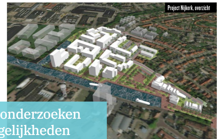
Project Nijkerk, overzicht

planologen wisselen voortdurend informatie uit om te komen tot aansprekende, samenhangende plannen die actuele en urgente vraagstukken beantwoorden.'