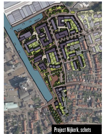
Project Nijkerk, schets