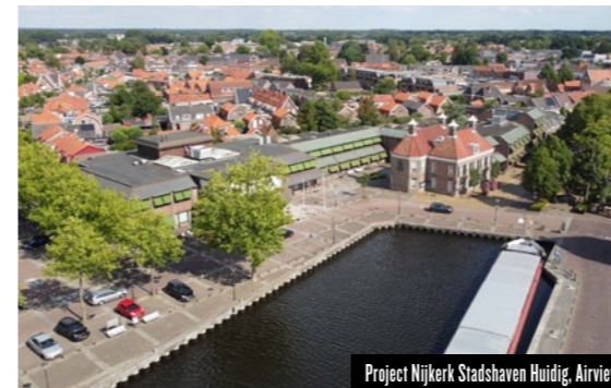
Project Nijkerk Stadshaven Huidig, Airview